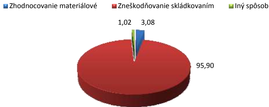
Graf 2 Podiel zhodnocovania a zneškodňovania odpadov v roku 2015 - prognóza