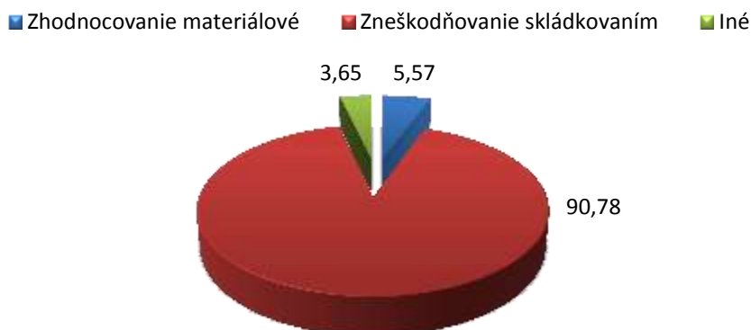
Graf 1 Dosiahnutý podiel zhodnocovania a zneškodňovania odpadov v roku 2005